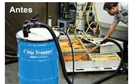
Las virutas pueden acumularse en el depósito, restringiendo el flujo del líquido refrigerante

Una limpieza regular del líquido refrigerante del tanque con el Chip Trapper, puede eliminar rápidamente estos costosos problemas y tiempos no productivos, evitando fallas humanas generadas por la falta de control del estado del líquido refrigerante y su reposición.