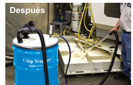
El Chip Trapper bombea el líquido refrigerante libre de contaminantes de vuelta al depósito